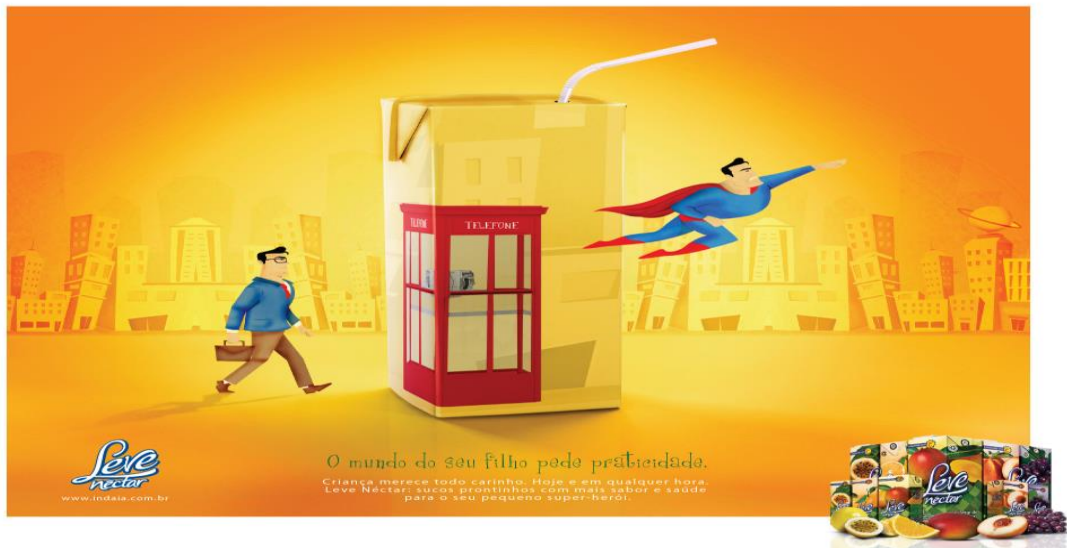
Figura 4: Anúncio suco em caixa