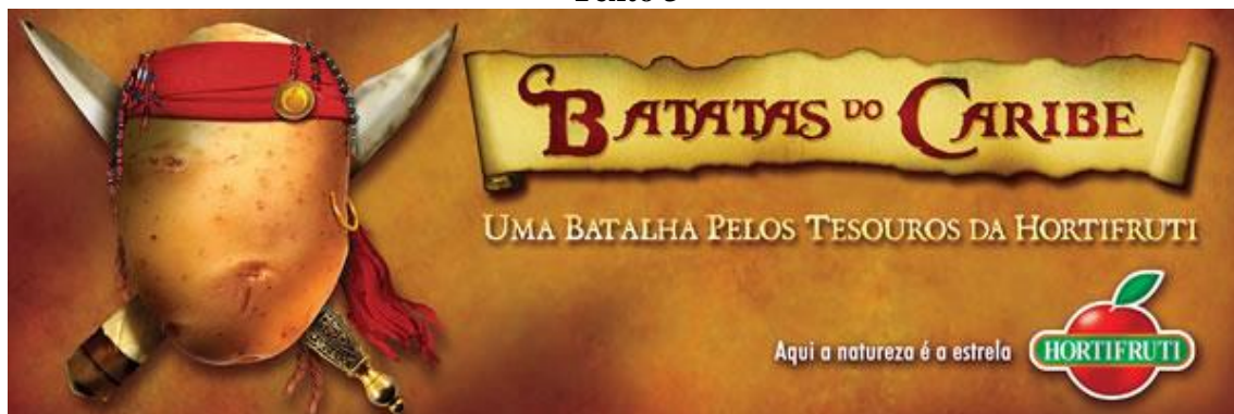
Figura 3: Anúncio de Hortifruti